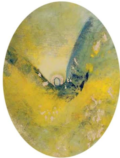
afb. Christell Holl – engel van de nacht

De loden last die op ons drukte, de stang, het juk, ons ongeluk, de zweep, de stok die diep deed bukken, verbrijzeld zijn ze, stuk voor stuk, verbrand de laarzen der soldaten en elke mantel rood van bloed, geen wapentuig meer door de straten – de velden vol van overvloed.