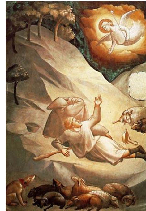
afb. Taddeo Gaddi - aankondiging aan de herders - Santa Croce, Florence 1327

gemeente O holy Child of Bethlehem, Descend to us, we pray; Cast out our sin, and enter in, Be born in us today. We hear the Christmas angels The great glad tidings tell; O come to us, abide with us, Our Lord Emmanuel.